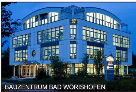
BAUZENTRUM BAD WÖRISHOFEN