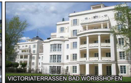
VICTORIATERRASSEN BAD WÖRISHOFEN