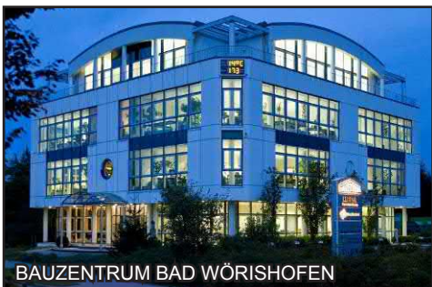
BAUZENTRUM BAD WÖRISHOFEN