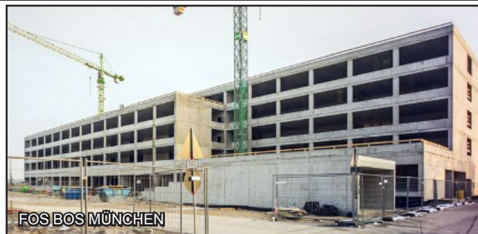
FOS BOS MÜNCHEN