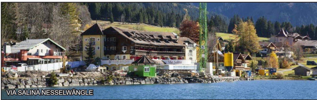
VIA SALINA NESSELWÄNGLE