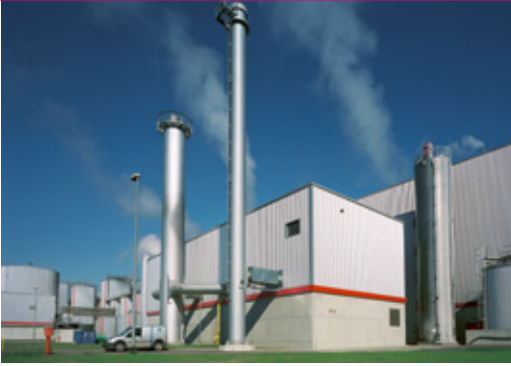
Pro Papier, Burg Energiezentrale