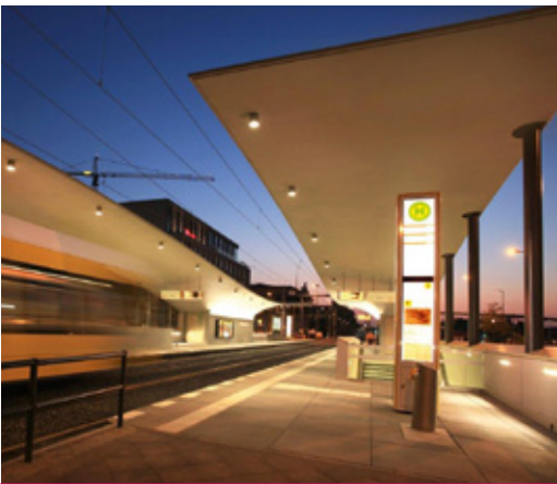
Haltestelle Invalidenstraße Berlin