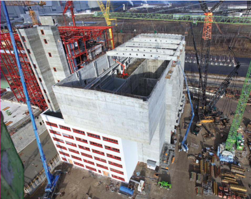
Rohbau EBS-Heizkraftwerk Spremberg