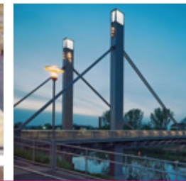
◀ Löwenbrücke Bamberg